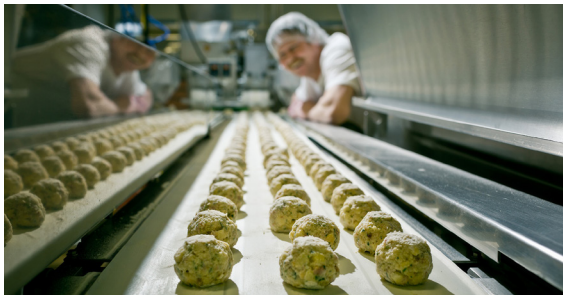
Bei Meisterfrost (nächste Seite) dient tiefgekühlte Hausmannskost auch als Energiespeicher.