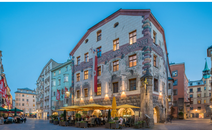
Im Hotel Restaurant Goldener Adler (nächste Seite), ist eine Symbiose aus historischem Ambiente und innovativem Energiemanagement gelungen.