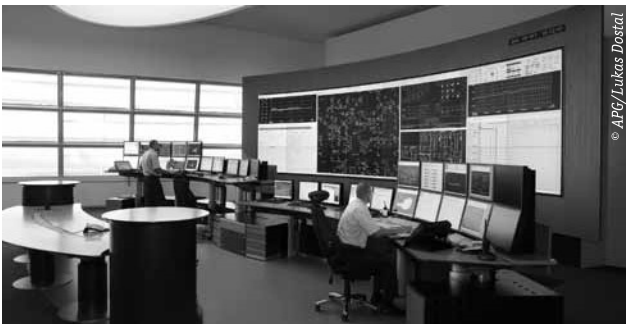
Die Steuerzentrale der Austrian Power Grid.

Schreckgespenst Blackout. Regelmäßig bringen Medien das Schreckensszenario eines Blackouts aufs Tapet, den totalen Zusammenbruch unserer Stromversorgung. Tatsächlich muss die Aufrechterhaltung unseres komplexen Stromversorgungssystems rund um die Uhr, praktisch in jeder Sekunde, mit beachtlichem Aufwand und hoher Präzision gemanagt werden. In Österreich hat die Austrian Power Grid (APG) die Aufgabe, die Infrastruktur der überregionalen Höchst- und Hochspannungsnetze zu betreuen und Netzschwankungen auszugleichen. Im Jänner und im Juni 2017 kam es zu Engpässen in der heimischen Stromversorgung. Die aktuelle Ausgabe von EIWInsights analysiert eingehend die Ursachen für diese kritischen Situationen und beschreibt, wie die „Stresstests“ erfolgreich gemeistert werden konnten.