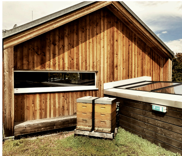
Bienenvölker auf dem Dach (oben) der markanten Firmenzentrale (rechts)

In Sachen Materialeffizienz konnte bei der traditionellen Almdudler Glasformflasche das Gewicht um 13 Prozent reduziert werden, und die PET-Flaschen enthalten über 20 Prozent Rezyklat.