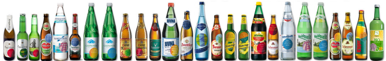
Unten: Kleiner Einblick in Österreichs reichhaltiges Mehrwegangebot

ist es gelungen, einen beachtlichen Beitrag zur CO 2 -Reduktion sowie zur Schließung von Stoffkreisläufen zu leisten.